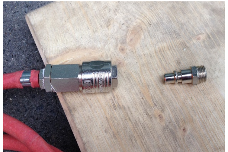
Durch ankuppeln des überzähligen Anschlussstückes die Luft aus der Pumpe herauslassen